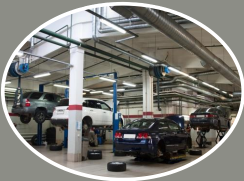
Warsztaty samochodowe, ASO;