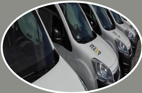
Wypożyczalnie pojazdów zastępczych;