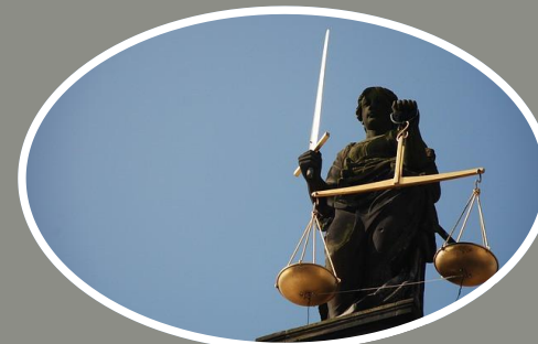
Podmioty zajmujące się zawodowo obrotem wierzytelnościami odszkodowawczymi np. kancelarie odszkodowawcze